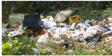
（国分寺北部校区コミュニティ協議会 環境・安全部会）