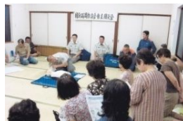
防災力UPに努めている様子

皆さまの自治会でされている防災訓練をぜひご紹介したいので、コミュニティセンターまで情報を提供ください。