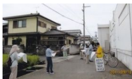
(国分寺北部自主防災会)