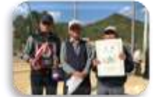
(国分寺町体育協会)