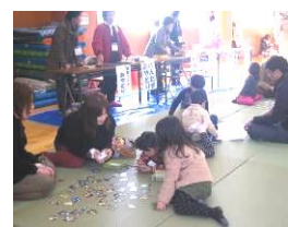
（国分寺町冬のまつり実行委員会）