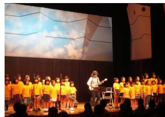
（音の祭り実行委員会）