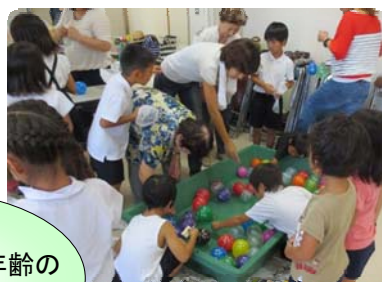
地域の大人や異年齢の 子どもとの交流活動