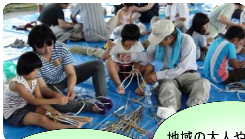
しめ縄作り、茶道華道、 キャンプ等の体験活動

実施日・・・第1、3木曜日の放課後、土曜日、日曜日、学校休業日。活動日は月単位にお知らせします。